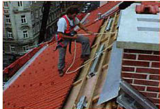
Die Montage eines Systems

Viele Kunden fragen mich, wenn wir auf das Thema Sicherheit am Dach kommen: "Und wie haben Sie bis jetzt gearbeitet?" Meine Antwort: Gesetzeswidrig und sehr gefährlich! Unsere Arbeit wird durch ein Dachsicherheitssystem nicht ungefährlich, doch wir können das Risiko senken. Ein wichtiger Punkt für Sie als Bauherr ist das Bauarbeitenkoordinationsgesetz, welches nun auch eine Haftung für den Bauherrn enthält. Diese Bestimmung kommt zum Tragen, wenn ein Arbeitsunfall passiert, und der Bauherr keine ausreichenden Sicherheitseinrichtungen zur Verfügung gestellt hat. Und genau in diesem Punkt möchten wir unser Wissen zur Verfügung stellen. Es gibt mittlerweile einige Systeme mit unterschiedlichen Einsatzmöglichkeiten am Markt und wenn Sie schon in die Sicherheit investieren, dann sollte es doch ein System sein welches auch verwendet wird.