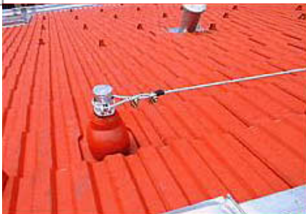
Endpunkt des Systems

Den Dachsicherheitshaken als Anschlagpunkt mit begrenztem Einsatz und ein umlaufendes Seilsystem, welches ein gesichertes Arbeiten am gesamten Dach erlaubt. Wir empfehlen das Seilsicherungssystem, weil es für Arbeiten am Dach die einzige wirklich handhabbare Lösung ist. Mit den Dachhaken muß man sich alle paar Meter umhängen um weiterarbeiten zu können, da der Arbeitsradius sehr beschränkt ist. Außerdem ist man bei jedem Umhängen ungesichert und verliert viel Zeit. Und dieser Zeitverlust kostet Sie als Bauherr Geld. Beim umlaufenden Seilsystem hängt man sich beim Aussteigen auf das Dach an und kann um das ganze Dach gehen ohne die Sicherung abzuhängen oder zu verändern. Dies ist auch von der wirtschaftlichen Seite sicher die bessere Lösung.